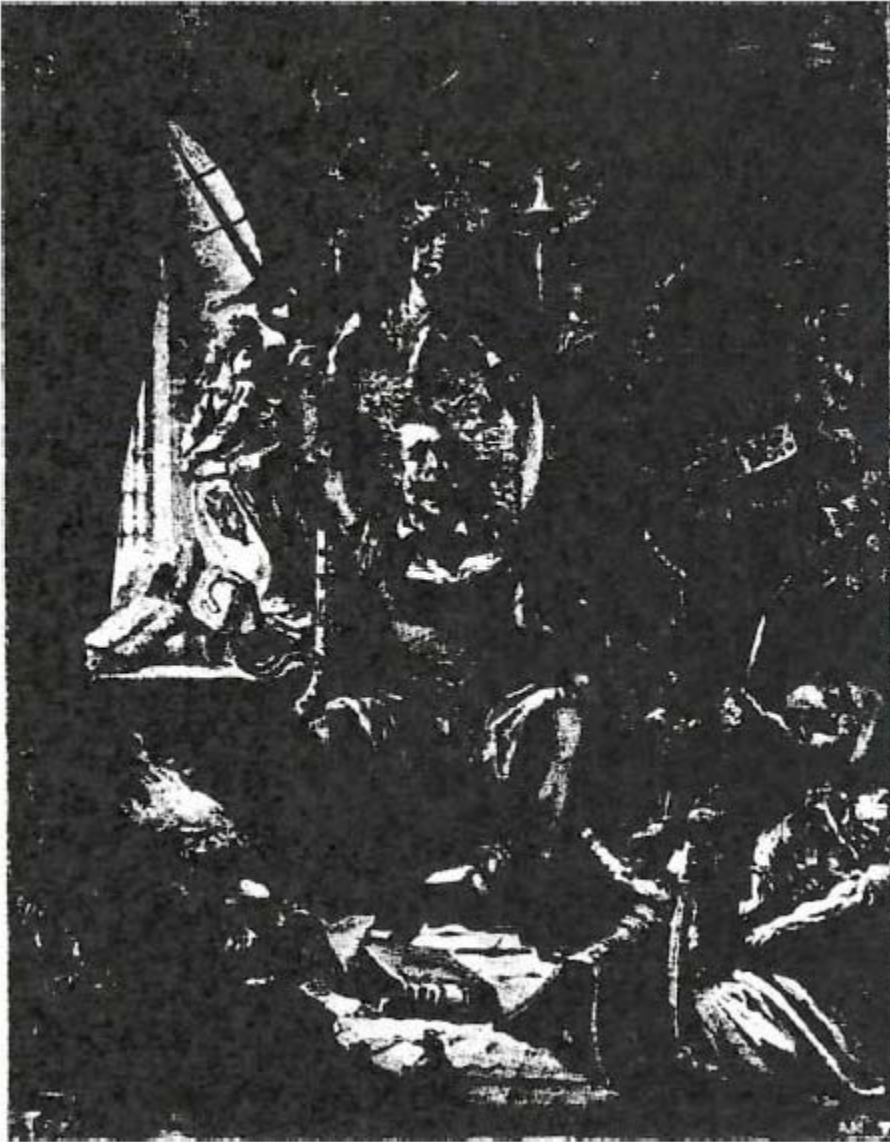
Impreso clandestinamente por la Mary Nardini gang I , compuesta por criminales queers de Milwaukee, Wisconsin.

además de militante en el movimiento feminista previo a Stonewall y colaboradora de Young Lords (“Jóvenes Señores”, organización nacionalista puertorriqueña importante en la época) y del Black Panther Party (“Partido Pantera Negra”, organización revolucionaria armada por la liberación de los negros). Tras un intento de suicidio en el Río Hudson en 1995, ésta volvería a la militancia en 2001 refundando STAR, que había quedado sin actividad al finalizar los setenta. STAR no fue en su refundación un grupo queer , sino un grupo trans más radical y alejado del oficialismo. Tras su muerte en 2002 bajo un diagnóstico de cáncer de hígado, sus compañeros proseguirían la lucha pocos años más. Sus intentos de recuperación institucional (tales como llamar con su nombre a una calle de Greenwich Village) han sido similares a los de su compañera Marsha P. Johnson.